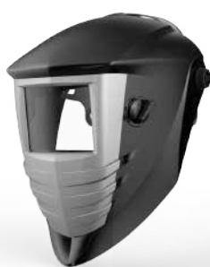
Strong Welder 1000