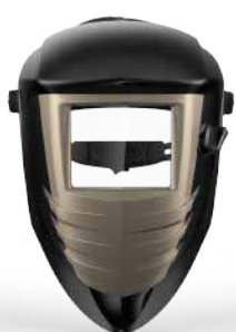
Strong Welder 1500