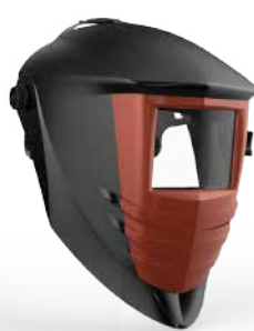
Strong Welder 2000